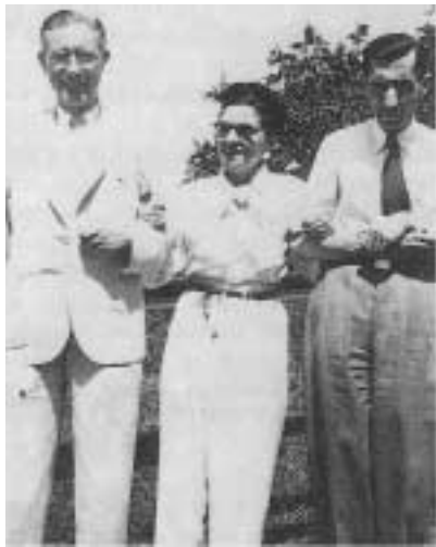
J.D. García Bacca con José Bergamín en Caracas, 1947

ciencia económica clásica (Smith, Ricardo...) y de la industria, deshacía esotro híbrido infecundo históricamente de sociología, hecha de política de Aristóteles y de Iglesia tomista (teocracia, monarquía teocrática). Caí en cuenta de ello en 1936, leyendo los Manuscritos económico-filosóficos de Marx, recién dados a la publicidad. Me convencí de la necesidad de estudiar economía. No la de Aristóteles o de Jenofonte..., sino la clásica ya y sus formas posteriores de que todos, de buena o mala gana, vivimos.